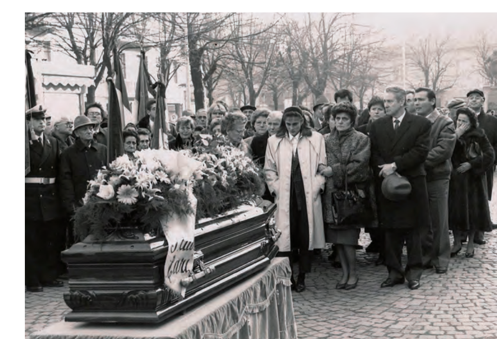
Due immagini fra le quali passano circa 45 anni: la prima è un momento dei funerali di due dei fratelli Piol, una lunga fila dolente che attraversa la città. La seconda ricorda l'estremo saluto dato da Rivoli alla sua "mamma coraggio", eroica figura della Resistenza rivolese, simbolo di umanità e di coraggio.